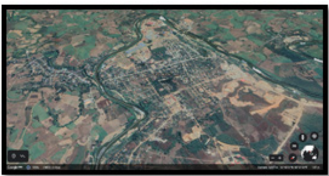
Figure 1: Map of Ethnic Armed Groups Controlled Area and Shwe Kokko's Stateline Images